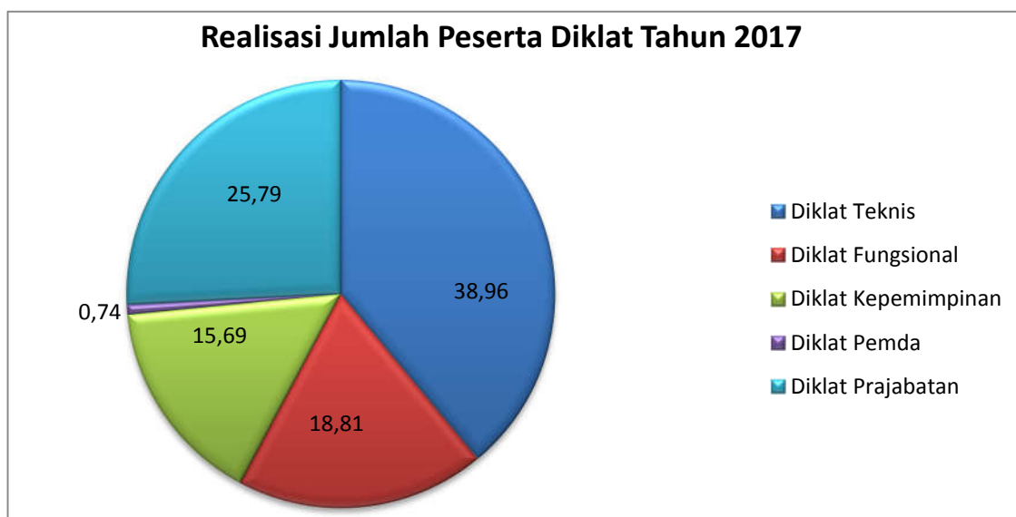
Gambar 3.1 Grafik Realisasi Jumlah Peserta Diklat Tahun 2017

Capaian kinerja Sasaran-1 dengan indikator jumlah ASN yang mengikuti diklat disajikan dalam Grafik Realisasi Jumlah Peserta Diklat tahun 2017 berdasarkan jenis diklat adalah sebagai berikut :